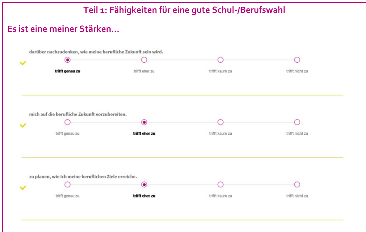
Grafik 1: Auszug aus dem Fragebogen zur Berufswahlreife

„Planung“). Hier finden Sie einen exemplarischen Auszug aus dem ersten Fragenkomplex zur Berufswahlreife: