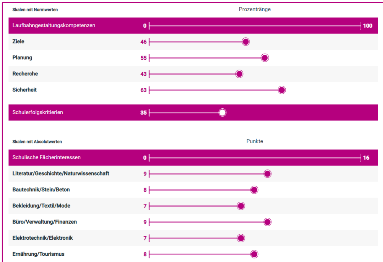
Grafik 7: Darstellung der Detailergebnisse von Schüler/inne/n im Hinblick auf Berufswahlreife (Laufbahngestaltungskompetenzen), Schulerfolgskriterien und Fächerinteressen

Interpretationshilfe: Die Laufbahngestaltungskompetenzen und Schulerfolgskriterien werden in Prozenträngen dargestellt. Ein Prozentrang gibt jeweils an, wo ein individuelles Ergebnis innerhalb einer Grundgesamtheit (hier: Schüler/innen der 7. Schulstufe) einzuordnen ist. Ein erreichter Prozentrang bei den Zielen von 46 bedeutet, dass 46 % der Normstichprobe entweder den selben Wert oder weniger erreicht haben, 54 % der Bezugsgruppe haben mehr Punkte erreicht.