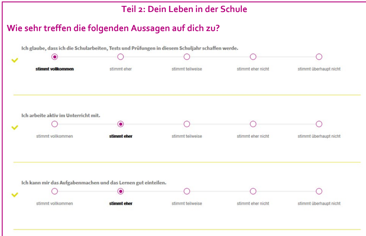
Grafik 2: Auszug aus dem Fragebogenteil zu den Schulerfolgskriterien

Der zweite Teil des BBO-Tools greift einige Fragen aus dem bewährten Stop-Dropout-Fragebogen, der teilweise im Jugendcoaching und auch in der überbetrieblichen Lehre Anwendung findet, auf. Mit einem Auszug aus diesem Fragebogen werden Faktoren zum Schulerfolg wie Selbsteinschätzung/Selbstwirksamkeit, Bildungsmotivation und Zugehörigkeit zur Klasse bzw. zur Schule abgefragt. Daraus sind mögliche Gefährdungen für die Bildungslaufbahn aufgrund von geringer Motivation, niedrig ausgeprägter Selbstwirksamkeit oder fehlender sozialer Zugehörigkeit ableitbar. Nachstehend sind einige ausgewählte Fragen aus dem BBO-Tool zu Schulerfolgskriterien dargestellt: